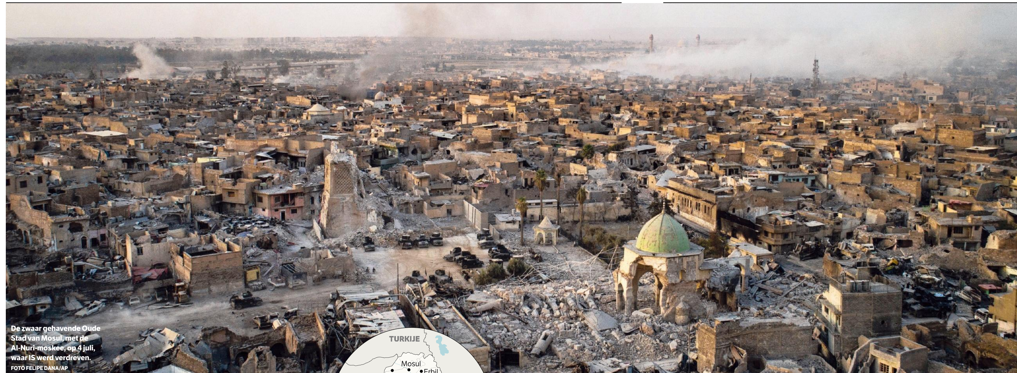
De zwaar gehavende Oude Stad van Mosul, met de Al-Nuri-moskee, op 4 juli, waar IS werd verdreven.